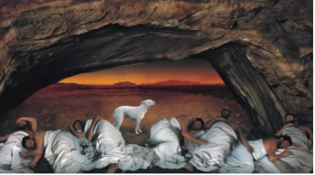
Resim 7. Balkan Naci İslimyeli, “Sanatçının 300 Yıllık Uykusunun Resmidir”, Tuval Üzerine Karışık Teknik, 90 x 105 cm., 1997-98, Sanatçının Koleksiyonu (URL-10, 2017).

resimlerinde simgesel ve romantik bir üslup kullandığı ifade edilmektedir. Kavramsal eserlerinde ise, eleştirel bir dille insanı ve doğayı ele aldığı düşünülmektedir (Ersoy, 2004, s. 282).