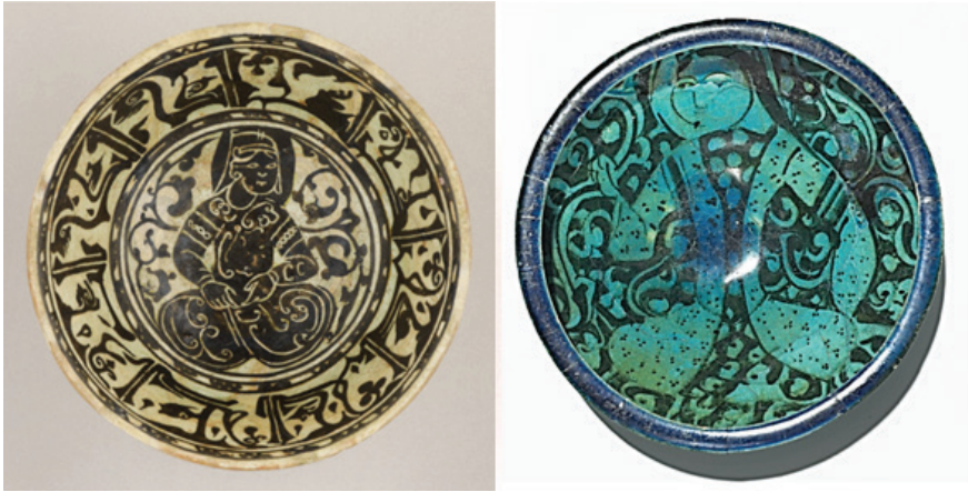
Şekil 4 Solda: Siluet Kazımalı kâse, İran (?), XII. yy. (?), Yükseklik 8,3 cm., Çapı 17,2 cm. The Smithsonian's Museum of Asian Art koleksiyonu, Kat. No. F1925.12. Sağda: Sıraltı süslemeli kâse, silisli bünye, turkuaz saydam sır, İran, XIII. yy. II. yarısı-XIV. yy. başı, Yükseklik 8,5 cm., Çapı 18,7 cm.

Tasarımlara bu açıdan baktığımızda Siluet Kazımalı seramiklerdeki ayna simetrlili kompozisyonların soyut içeriği biraz daha fazla önem ve anlam kazanmaktadır. Bu tarz bitkisel tasarımlarda kalın etli kıvrım uçlu yaprakların geleneksel Selçuklu ince saz yapraklı bitkilerden farkı çok daha belirgin bir şekilde ortaya çıkmaktadır (Ettinghausen vd., 2001, s. 173, No. 268). Bu ilginç motifler doğada sessiz hayat süren bitkilerden çok baskın, hatta hamasi bir tabiata sahip yırtıcı canlıları çağrıştırmaktadırlar. Büyük olasılıkla bu süslemeler optik görünümüleriyle örtüşmeyen daha kavramsal ve mistik bir mana yüklüdürler. İskit, Hun ve Göktürk sanatı örnekleriyle karşılaştırıldıklarında benzerliklerin hem düzenleme şekli hem de betimleme tarzındaki mevcudiyeti, akla V.A. Gorotsov'un Maddi Verilerin 5 Mevcudiyet Kuramı içinde yer alan 3. Endüstriyel üretimlerde benimsemeler kuralını getirmektedir. Bu kuralda vurgulandığı gibi farklı kültürle ait olan maddi veriler arasında dikkati çeken benzerlikler benimsemeler olarak görülmelidir. Siluet Kazımalı seramiklerde karşımıza çıkan benimsemeleri etnik veya genetik kaynaklı olarak tanımlamak mümkündür. (Şekil 3)