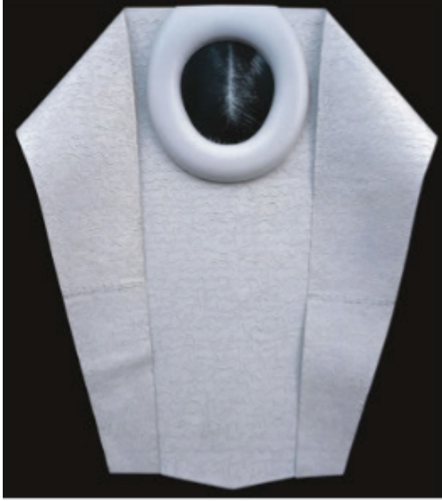
Resim 8. Balkan Naci İslimyeli, “Deli Gömleği”, 175 x 223 cm. 1990 (URL-11, 2017).

“Deli Gömleği” adlı eserinde İslimyeli, tasavvuftaki zikir ritüeline gönderme yapmaktadır. Sanatçının eserlerinde, beyazı İslam inancıyla bütünlüştürerek kullandığı düşünülmektedir. Bu bağlamda sanatçının eserlerinde kullandığı beyaz saflık, kudret ve aidiyeti temsil etmektedir.