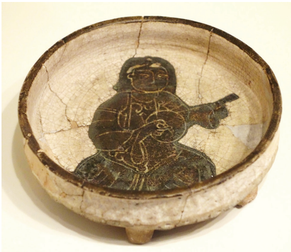
Şekil 1. Üçayaklı Siluet Kazımalı tabak, silisli bünye, kalın siyah astar. Selçuklu ekolü, XII. yy. II. yarısı, Cincinnati Art Museum.

Selçuklu seramik ekolünün baskın yaratıcı dürtüsü sayesinde ortaya çıkan Siluet Kazımalı süsleme tekniği uzmanlar arasında dahi fazla bilinmemektedir. Kaynaklarda bu türden seramikler bazen sıraltı bazen ise kırmızı çamurdan yapılmış champleve seramikleriyle karıştırılmaktadırlar. Tekniğin ortaya çıkma serüveni Selçuklu ustalarının mesleklerine karşı davranışını ve silisli bünye ile ilişkilerini tanımak adına güzel bir örnek sayılabilir. Siluet Kazımalı uygulamaların başlangıcı silisli bünyenin daha yeni kullanıma girdiği zamanlara denk gelmektedir. Bu nedenle ustalar henüz iyi bilinmeyen kompozit çamuru her yönüyle ele almakta, parlak beyaz rengini, saydamlığını, ince cidar olanaklarını çeşitli vesilelerle denemekte ve en güzel sonuca ulaşmak amacı uğrunda sayısız tecrübeler tatbik etmektedirler. Söz konusu süreç Siluet Kazımalı tekniğin yanı sıra pek çok diğer Selçuklu buluşlarının ortaya çıkmasına neden olmuştur. Araştırmamızda V.A. Gorotsov'un Maddi Verilerin 5 Mevcudiyet Kuramı içinde yer alan Endüstriyel nedensellik ilkesiyle ilişkili ele alınan Siluet Kazımalı Selçuklu tekniğinin diğer ilkeleriyle alakaları aranırken, bu sistemin tarihi seramiklerin değerlendirme süresindeki faydalılığı ve Türk bilimi için gerekliliği de tespit edilmeğe çalışılmıştır.