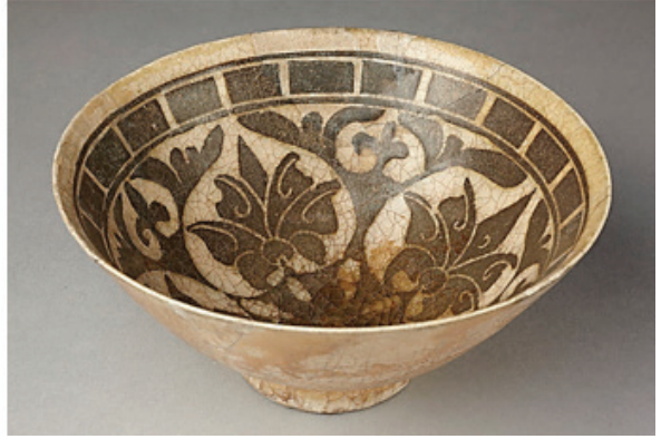
Şekil 5. Solda: Astar süslemeli kâse, kırmızı kil, siyah ve beyaz astar, saydam renksiz sır, Nişapur (?), IX-X. yy.; Sağda: Siluet Kazımalı kâse, silisli bünye, siyah astar, saydam renksiz sır, İran, Rey, XII. yy. sonu.

Üretim zincirinin halkaları V.A. Gorotsov'un 1. Endüstriyel nedensellik kuramına göre dizildiğinde maden eserleri Kazımalı-Akıtmalı ürünler, onları ise Siluet Kazımalı seramikler takip etmiş olmalıdırlar. Bu nedenle maden kaplar ile Siluet Kazımalı seramikler arasındaki görsel benzerliği hem dolaylı benimseme hem de rasgele benzerlik olarak değerlendirmek yerinde olacaktır.