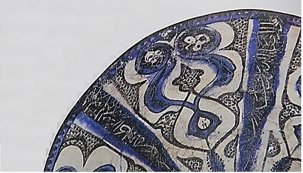
Şekil 7. Selçuklu kâsesi detayı, saydam renksiz sır altına siyah ve kobalt mavisi boyama, İran, XIII. yy. Yükseklik 10,5 cm, çapı 22,5 cm.

Siluet Kazımalı'lar ile Kazımalı-Akıtmalı'lar arasındaki genetik bağı tespit ettikten sonra Watson'un yukarıda sözü geçen faraziyesine yeniden dönebiliriz. Bilindiği gibi Watson kalın siyah astarı sıraltı boya arayışlarında ara merhale olarak görmektedir. Bu faraziyenin haklı olabileceğini düşünen Fehervari günümüze ulaşan birkaç seramik örneği süsleme açısından ele alarak olası kanıt şeklinde sunmaktadır (Fehervari, 2000, s. 108-109, No. 126, 127, 128; Fehervari, 1974, 107-41, no. 71-101, plate 95/a). Astar kazıma ile fırça uygulamalarının bir arada bulunduğu bu örnekleri Fehervari erken sıraltı seramikler olarak görmek ve yeni tekniğin kademeli gelişmeler neticesinde ortaya çıkabileceğini varsaymaktadır.