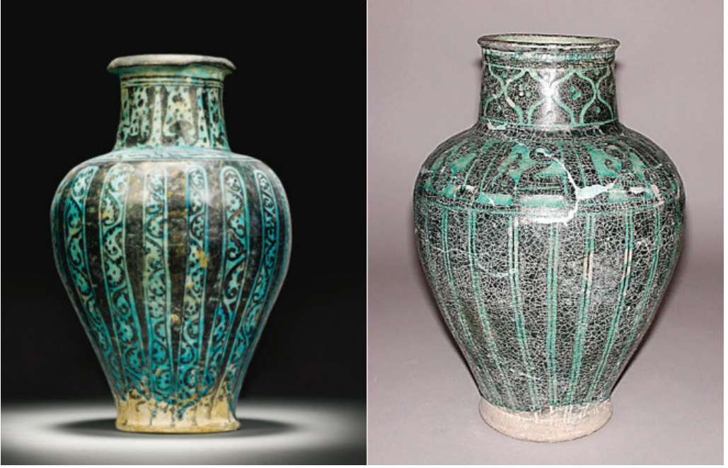
Şekil 2. Solda: Seramik vazo, silisli çamur, sıraltı süsleme, turkuaz sır, Suriye, Rakka, XIII. yy. başı. Sağda: Silüet Kazımalı vazo, Selçuklu, 12.yy. The Fitzwilliam Museum.

İngilizce “ Silhouette Ware ” olarak bilinen bu seramiklerin adı, üzerlerindeki motiflerin gölge tiyatrosunda olduğu gibi açık zemin üzerinde siyah silüet şeklinde gözükmesinden ileri gelmiştir. Teknik, beyaz silisli bünye üzerine kalın tabaka halinde sürülen siyah astarın kazılarak bazı bölgelerden tamamen kaldırılmasından ibarettir (Watson, 1995, s. 44-49). Bu sayede motifler siyah, arka plan ise kullanılmış sıra bağı olarak ya beyaz ya da renklidir. Uygulanmış olan sır türüne bağlı olarak Silüet Kazımalı seramikleri saydam renksiz ve saydam renkli (turkuaz veya kobalt mavisi) sırlı olmak üzere iki gruba ayırıştırmak mümkündür. Makalede kullanılan Türkçe “Silüet Kazımalı” tanımı ise bir taraftan motiflerin silüet halindeki görünümüne, diğer taraftan ise onların betimleme tekniğine dayalı geliştirilmiştir.