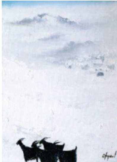
Resim 1. Fikret Otyam, Tuval Üzerine Yağlıboya (URL-2, 2017).

Otyam, 1953 yılında Bedri Rahmi Eyüboğlu atölyesinden mezun olmuştur. Öğrencilik yıllarında gazeteciliğe başlamıştır, özellikle Doğu ve Güneydoğu Anadolu insanının yaşamını tanıtan röportajlar yapmıştır. Gazetecilik yaparken resme de devam etmiştir, 1980 senesine kadar fotoğraf sanatçılığı ve yazarlıkla ilgilenmiştir. Özellikle 1950 sonrasında resimlerinde Anadolu insanını resmetmiştir. Lekenin yoğun olarak algılandığı eserlerinde, açık-koyu değerler öne çıkmaktadır. Zaman içerisinde eserlerinde figür ve biçimlerin yalınlaştığı görülmektedir (Bircan, 1997, s. 13).