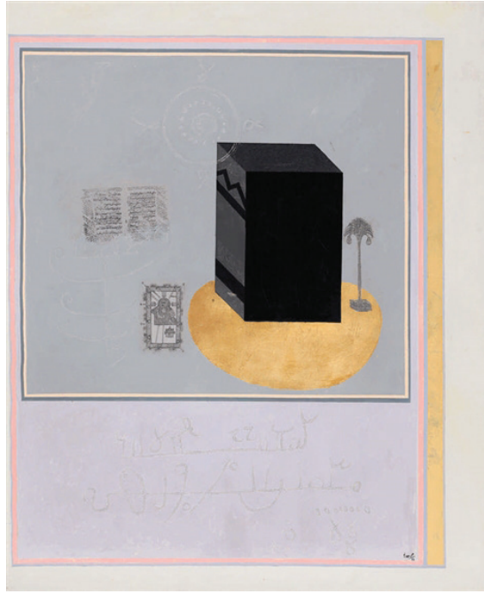
Resim 4. Erol Akyavaş, "Kâbe", Tuval Üzerine Karışık Teknik, 116 x 142 cm., 1988 (URL-6, 2018).

Resim 3'te çizgisel ifadelerin yoğun olarak kullanıldığı görülmektedir. Kerbelâ hâdisesinin anlatıldığı eserde, hakim renk beyazdır. Kerbelâ Hadisesi, Yezid'in Hz. Hüseyin'e olan düşmanlığına dayanmaktadır. Hz. Muhammed vefatından sonra, ümmetini idare edecek kişisi seçmek istemiştir. O'nun ölümünden sonra dört halifenin üçü iktidar kavgaları nedeniyle öldürülmüştür. Hz. Ali'nin vefatı sonrasında yerine büyük oğlu Hz. Hasan'ın geçmesine, Muaviye engel olmuştur. Muaviye'nin ölümünün ardından oğlu Yezid yönetime geçmiştir. Bu dönemde Hz. Hüseyin halife kabul edilmiştir. Ancak bu durum Yezid'e rahatsızlık vermiş, sonunda Hz. Hüseyin H. 10 Muharrem 61/M. 10 Ekim 680 tarihinde şehit edilmiştir (Gürbüz, 2012, s. 130). Erol Akyavaş'ın tasavvuf ile ilişkilendirerek, eserler ürettiği bilinmektedir. Bu eserde sanatçının "Kerbelâ Serisi" içerisinde yer almaktadır. Bir eskiz niteliğinde oluşturduğu eserinde, hâkim tonun beyaz olması maneviyatla ilişkilendirilebilir. Beyaz bu eserde, hem şehitlik mertebesine hem Hz. Hüseyin'e olan saygıyı ve sanatçının ulvi duygularını belirtmede kullanılmıştır.