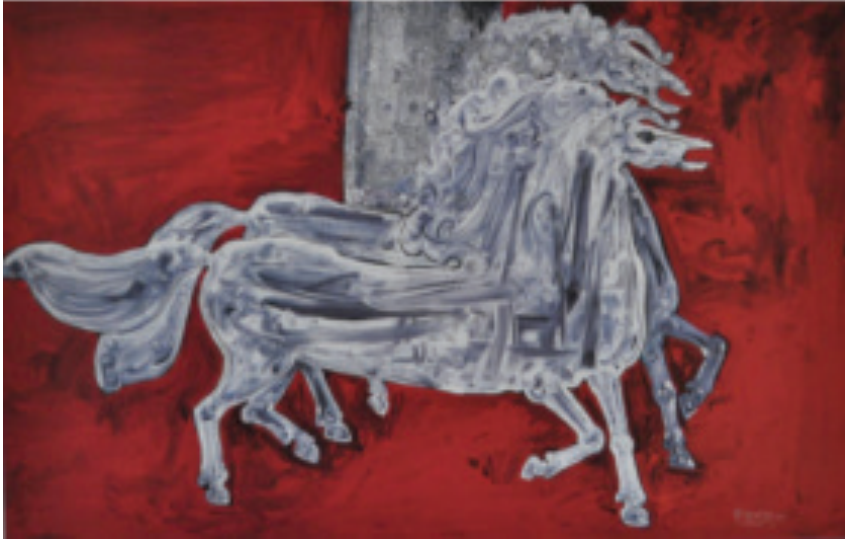
Resim 5. Süleyman Saim Tekcan, “Dolu Dizgin Atlar”, Tuval Üzerine Yağlıboya, 100 x 150 cm. 2000 (URL-7, 2017).

Özgün baskı üzerine yoğunlaşan sanatçı, 1971 senesinde Almanya'da baskı eğitimi üzerine araştırmalar yapmış ve bu eğitimin Türkiye'de de benimsenmesine katkı sağlamıştır. Sanatçının resmettiği atların, Türk kültüründe önemli bir yere sahip olduğu ve minyatür sanatında da kullanıldığı bilinmektedir (Ersoy, 2004, s. 455).