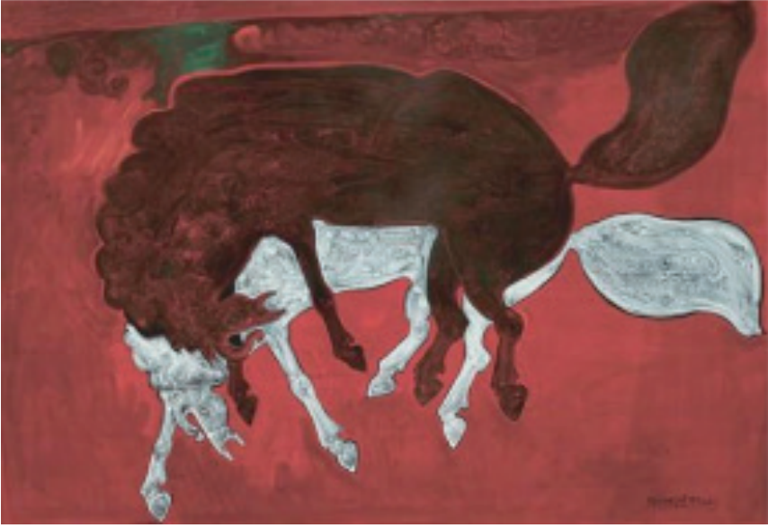
Resim 6. Süleyman Saim Tekcan, “İsimsiz”, Tuval Üzerine Yağlıboya, 135 x 185 cm. 2003 (URL-8, 2017).

Resim 6’da klasik bir hayvan mücadelesi betimlenmiştir. Kırmızı bir arka fon üzerinde kahverengi tonlarında bir atın, beyaz bir ata üstün geldiği görülmektedir. Her iki figürün de mücadeleden yorgun düştükleri izlenimi vardır. Savaşlarda ve binek olarak kullanılan atlar, Türklere avantaj sağlamıştır. Orta Asya’dan beri atın, özel bir yeri olmuştur. Eserde yer alan beyaz atın kutsallığa işaret ettiği düşünülmektedir. Ögele (2014a, s. 620) göre, Kitan’ların erkek ataları beyaz ata biniyorlardı. Altay Şamanizm’inde ilahi görülen aklık, Temizlik ve paklık anlamına geliyordu, hayvan için kullanıldığında ise, beyaz asıl anlamına erişmekteydi.