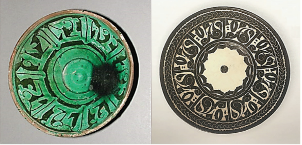
Şekil 6. Solda: Gabri-Garrus kâsesi, Kırmızı kil, beyaz astar kazıma, saydam yeşil sır. Selçuklu çağı, XII-XIII yy. Sağda: Nişapur yazı süslemeli astar boyalı kâse, MS. X yy. Çapı 28 cm.

içinde yerleşerek belirleyici sıfat şeklini kazanmışlardır. Hepsinin ortak yanı kırmızı kil bünyeye sahip olması, beyaz astarla kaplanarak daha sonra kil zemine kadar kazılmasıdır. Sırlama öncesi kimi ürünler sadece bakır oksit, kimileri bakır ile mangan oksit, kimileri ise demir, mangan ve bakır oksitlerle boyanmışlardır. Bunların tipolojisi de kazıma ve boyama şekline dayanarak oluşturulmuştur.