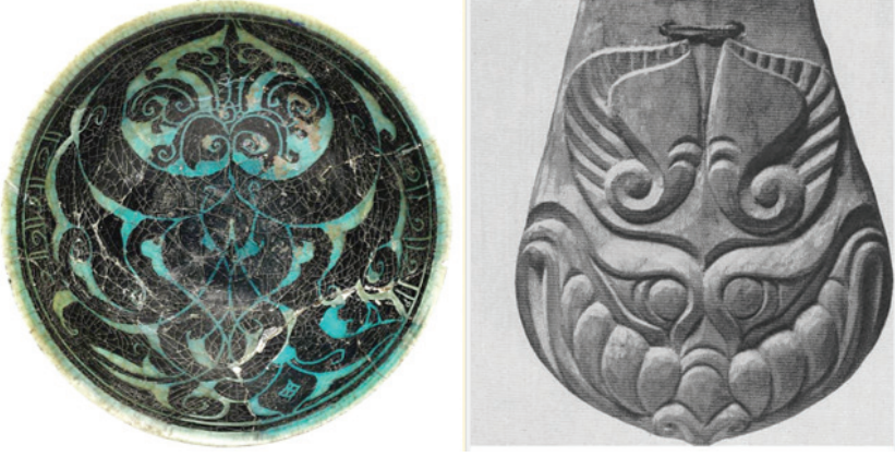
Şekil 3. Solda: Siluet Kazımalı kâse, Silisli bünye, turkuaz sır, siyah astar. MS.1200, Çapı 20 cm, İran, Keşan. Sağda: Ahşap sarkıntı parçası, 1. Pazırık kurganı buluntularından. Üzerinde Grifonun başı önden betimlenmiştir.

Tasarımlara bu açıdan baktığımızda Siluet Kazımalı seramiklerdeki ayna simetrlili kompozisyonların soyut içeriği biraz daha fazla önem ve anlam kazanmaktadır. Bu tarz bitkisel tasarımlarda kalın etli kıvrım uçlu yaprakların geleneksel Selçuklu ince saz yapraklı bitkilerden farkı çok daha belirgin bir şekilde ortaya çıkmaktadır (Ettinghausen vd., 2001, s. 173, No. 268). Bu ilginç motifler doğada sessiz hayat süren bitkilerden çok baskın, hatta hamasi bir tabiata sahip yırtıcı canlıları çağrıştırmaktadırlar. Büyük olasılıkla bu süslemeler optik görünümüleriyle örtüşmeyen daha kavramsal ve mistik bir mana yüklüdürler. İskit, Hun ve Göktürk sanatı örnekleriyle karşılaştırıldıklarında benzerliklerin hem düzenleme şekli hem de betimleme tarzındaki mevcudiyeti, akla V.A. Gorotsov'un Maddi Verilerin 5 Mevcudiyet Kuramı içinde yer alan 3. Endüstriyel üretimlerde benimsemeler kuralını getirmektedir. Bu kuralda vurgulandığı gibi farklı kültürle ait olan maddi veriler arasında dikkati çeken benzerlikler benimsemeler olarak görülmelidir. Siluet Kazımalı seramiklerde karşımıza çıkan benimsemeleri etnik veya genetik kaynaklı olarak tanımlamak mümkündür. (Şekil 3)